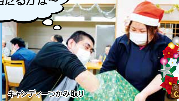
キャンディーつかみ取り