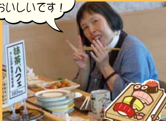
「すし江戸山手台店」にて