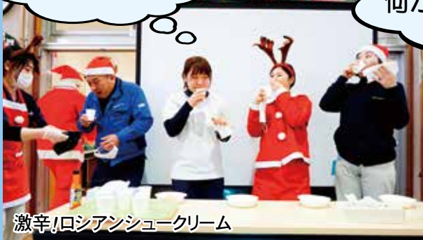
激辛！ロシアンシュークリーム