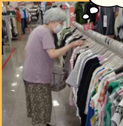
「イオンスタイル御所野店」にて